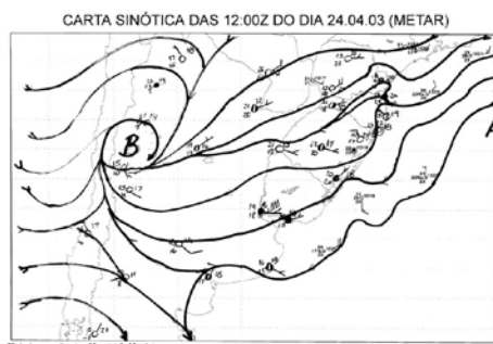
Figura 1 - Carta Sinótica das 12:00Z do dia 24/04/03 (METAR).

Neste caso os ventos predominantes em todas as regiões catarinenses deveriam ser de nordeste a norte, mas em algumas áreas do litoral, como áreas ao sul de Laguna já estudadas por Monteiro e Furtado (1995), possuem, em alguns meses do ano, direções predominantes de sudoeste. Não diferem deste cenário os ventos que sopram em São Francisco do Sul, município localizado no Litoral Norte, conforme figura 2.